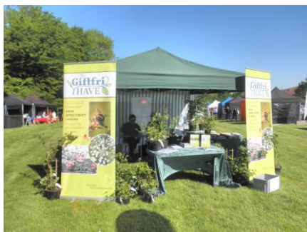
Folkemødet i Høng "Giftfri Have"