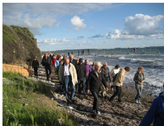
Røsnæs sydvendte skrænter