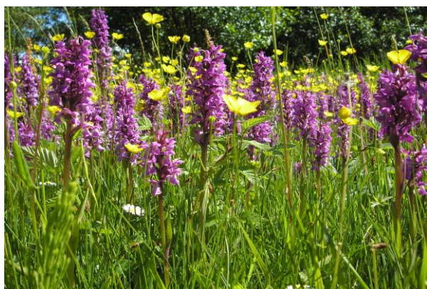
Gøgeurter ved Bjerge strand

Tak for jeres opmærksomhed og kom godt hjem.