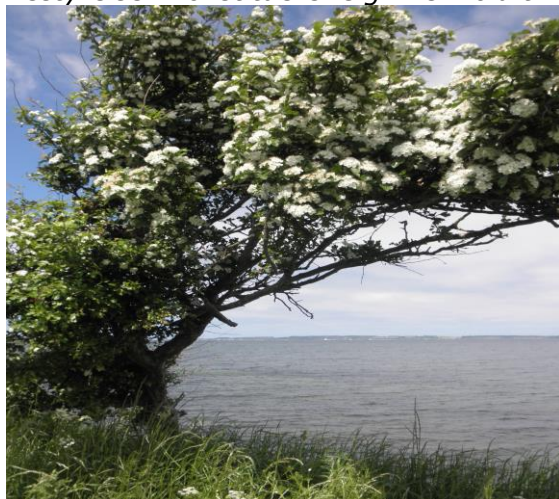
Blomstrende Hvidtjørn på Asnæs