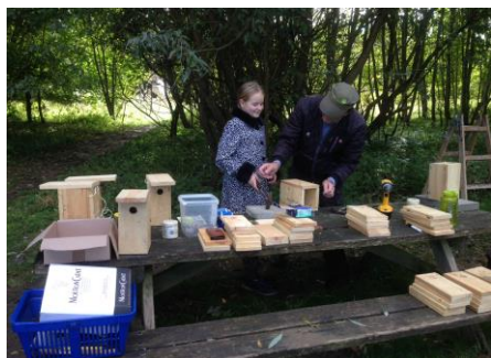
Fuglekassebygning Høng skov