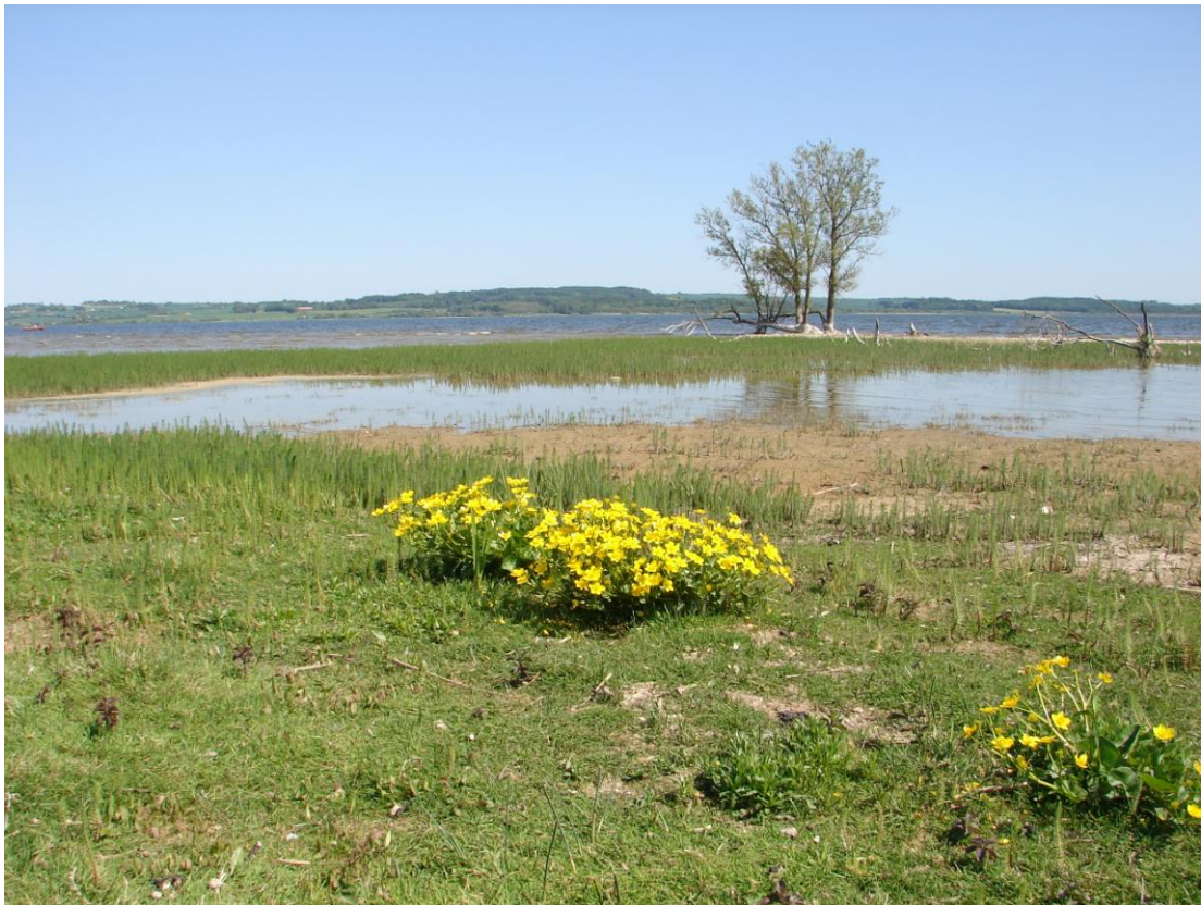
Figur 2. Den ret åbne strandbred med Eng-Kabbeleje og masser af Hestehale i baggrunden.