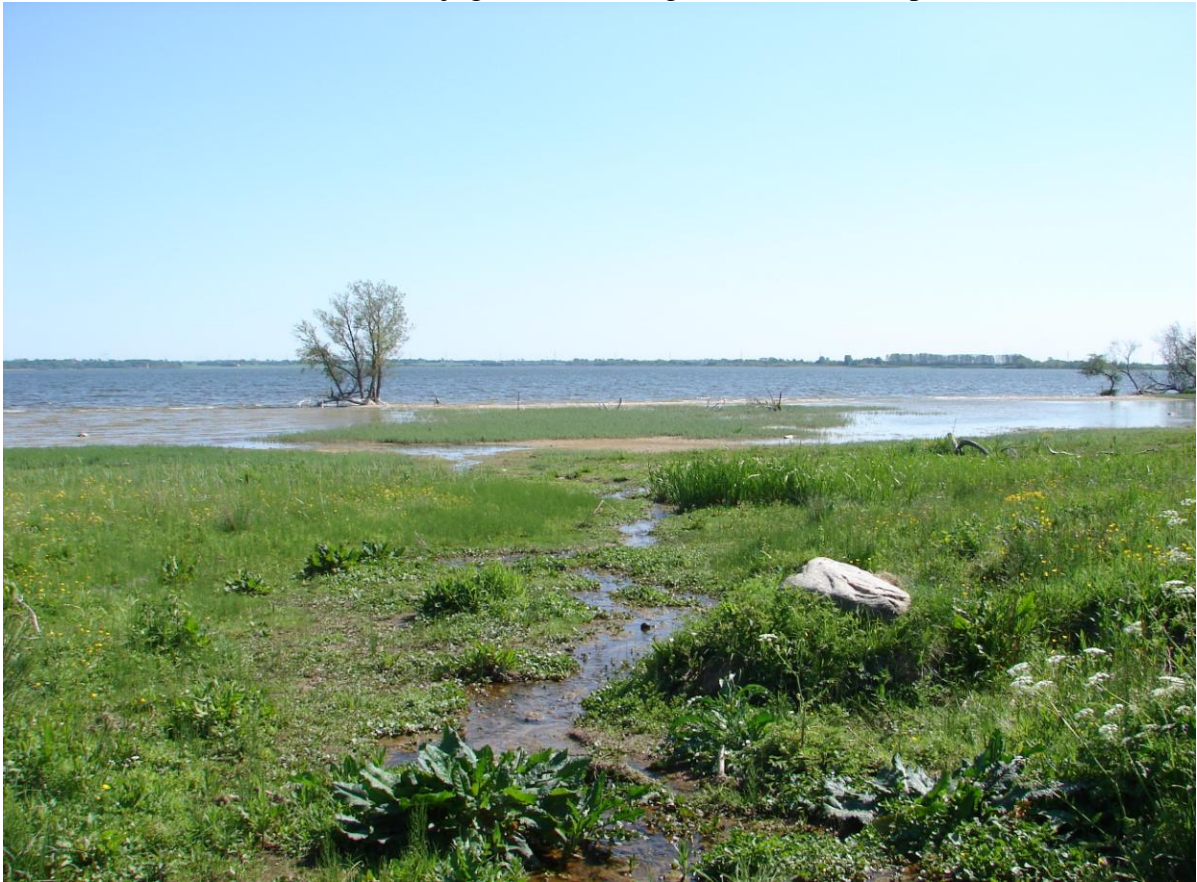
Figur 3. Et lille vandløb løber ud i Tissø syd for pumpestationen. Længst ude mod Tissø står en stor bevoksning af Hestehale.

Tak til Lars Hansen fordi vi fik lejlighed til at besøge denne lille naturperle.