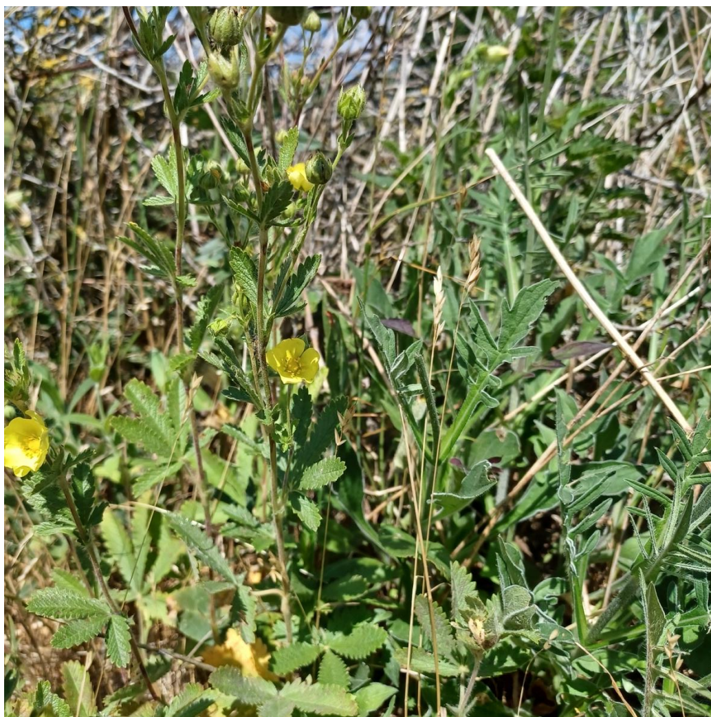
Figur 4. Rank Potentil.

Eng og overdrev mod nord er blomsterrige med arter som Blåhat, Blæresmælde, Alm. Røllike, Mark-Frytle, Mark-Krageklo, Prikbladet Perikon, Alm. Kællingetand, Høst-Borst og mange andre almindelige arter. Vi bemærkede den på Sjælland ret sjældne (Hartvig 2015) Rank Potentil, som står flere steder (figur 4). Den er sandsynligvis indført til Danmark og under udbredelse. Den grusede og næringsfattige jord giver grobund til en del arter.