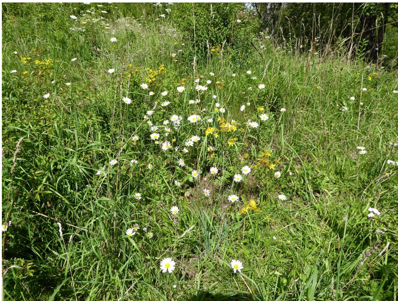
Figur 5. Hvid Okseøje og Prikbladet Perikon er blandt de mange almindelige og dejlige planter på Egebjerg.

Bugtet Frøstjerne er en art, som vi ikke har set før. Den ligner Sand-Frøstjerne meget og adskilles fra denne ved, at støvbladene har et tilspidset, forhøjet konnektiv (forbindelsesled, udvækst) (Mossberg og Stenberg, 2020). Bugtet Frøstjerne forekommer kun få steder i Danmark, og faktisk er den rødlistet som Næsten Truet i den nyeste rødliste (Rødliste 2019). Men den er tidligere dyrket som både grøntsag og prydblade, og mange forekomster anses for at være forvildede fra dyrkning, og den er ikke til at skille fra de vilde forekomster (Hartvig 2015). Netop på et sted som her på Egebjergs tidligere losseplads findes der ganske mange forvildede haveplanter, og det er mest sandsynligt, at Bugtet Frøstjerne stammer fra en have. Bugtet-Frøstjerne ( Thalictrum minus ssp. arenarium ) er kun adskilt på underarts-niveau fra Sand-Frøstjerne ( Thalictrum minus ssp. minus ).