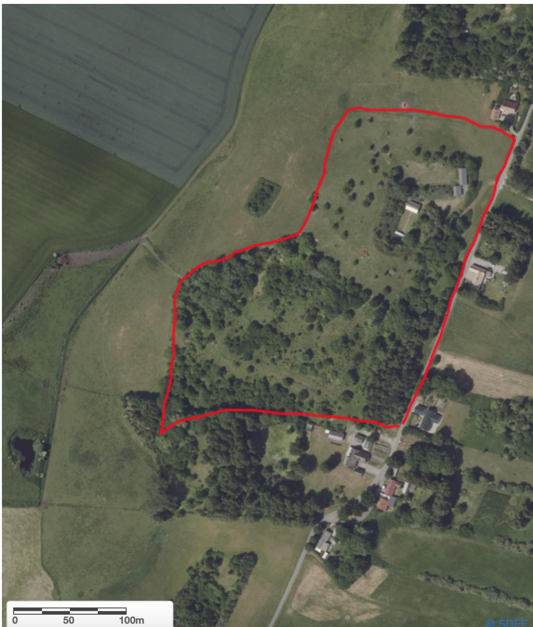
Figur 2. Ortofoto af Egebjerg 2022, det undersøgte areal er markeret af en rød linje.

Evt. henvendelse: carstenbclausen@hotmail.dk