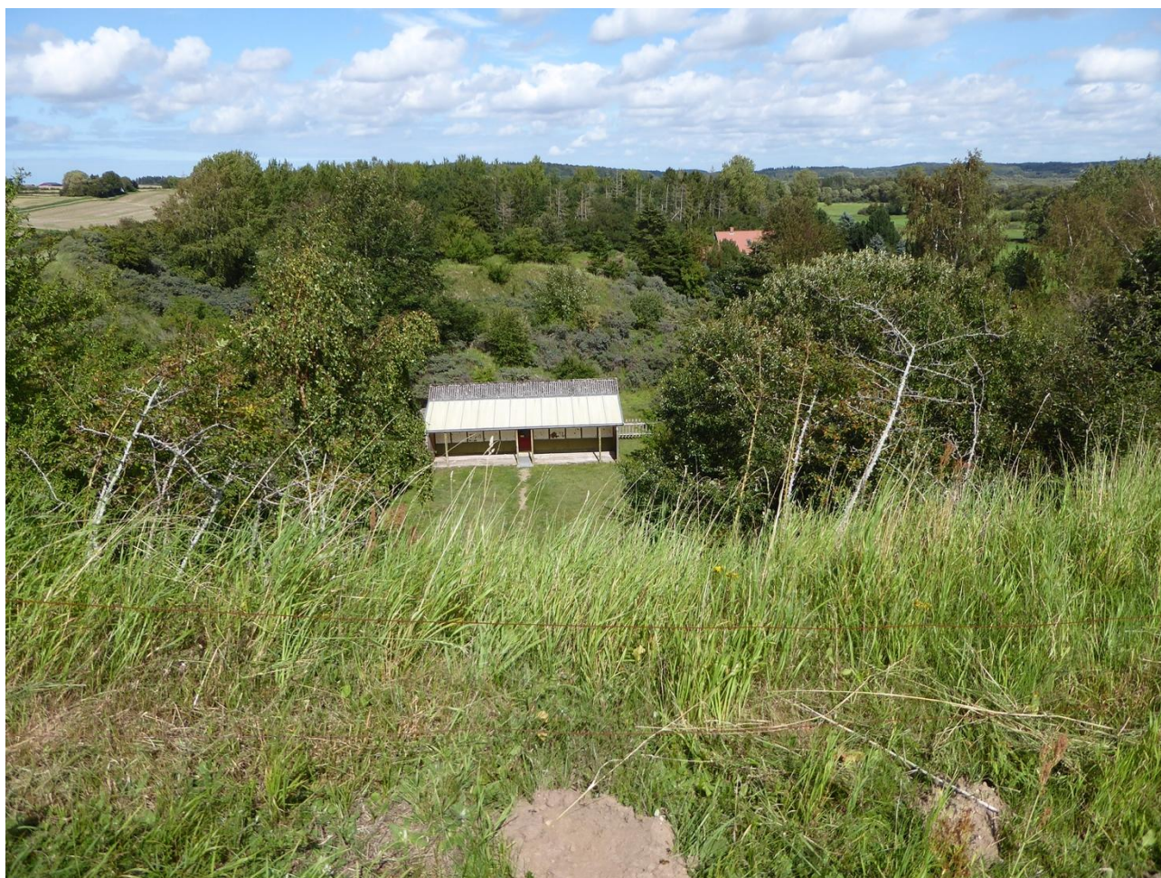
Figur 3. Et kig ned til skydebanen, der ligger dybt nede i den tidligere grusgrav.

Arealet er hegnet og i august 2023 er det noget siden, at bakken har været græsset. Området er ret tilgroet, hvilket kan ses på figur 2, og arealet er meget kuperet pga. tidligere grusgravning. Hvidebæk Skytteforening har klubhus og skydebane i et af grusgravens store grave, og der er ikke offentlig adgang til denne del af bakken (figur 3).