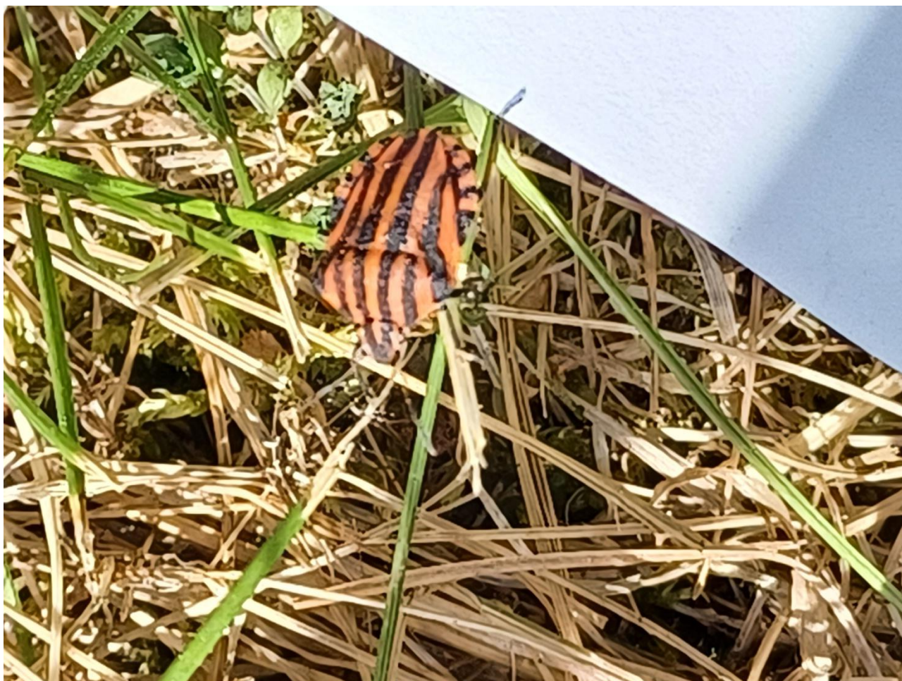
Figur 7. Stribetæge, også spøgefuldt kaldet A. C. Milan-tæge med hentydning til den italienske fodboldklubs spilledragt. Første fund i Danmark er fra 1992.

Rødliste 2019: Den danske Rødliste. - AU Ecoscience.