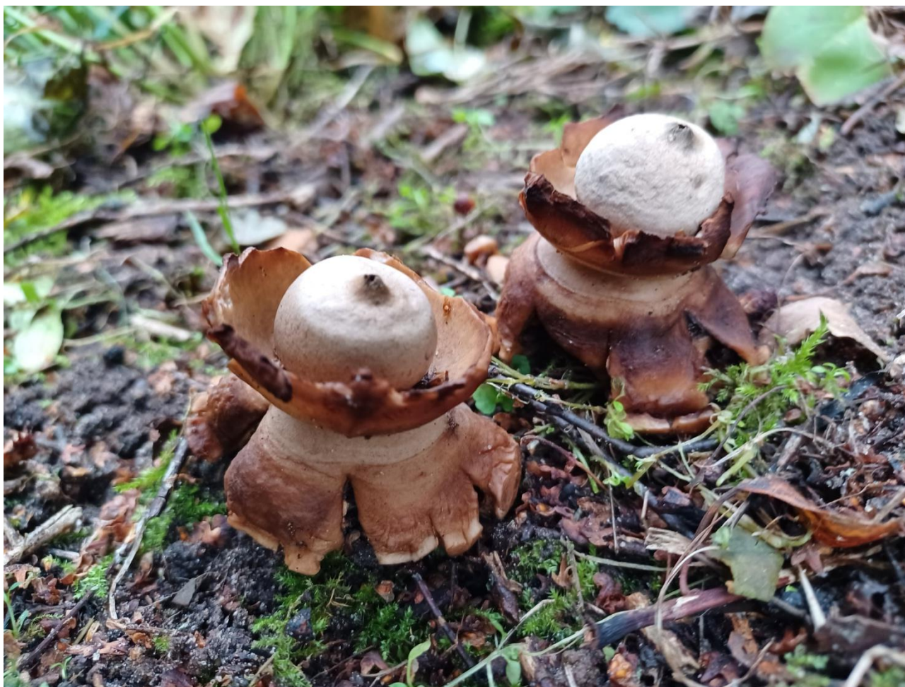
Figur 6. Kødet Stjernebold

Med til billedet af Egebjergs flora hører også en lille og lidt sølle skov af mest Østrigsk Fyr langs med Madesøvej. Inde på selve arealet mod nord står en bemærkelsesværdig stor Sejle-Pil. En god informationstavle står ved en lille P-plads vest for skoven, den er opsat af Naturpark Åmosen og Kalundborg kommune.