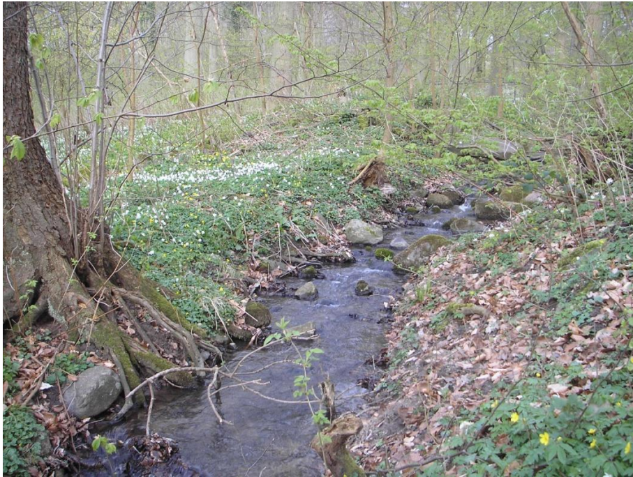
Figur 12. Bækken forsynede geddeklækkeriet med vand.