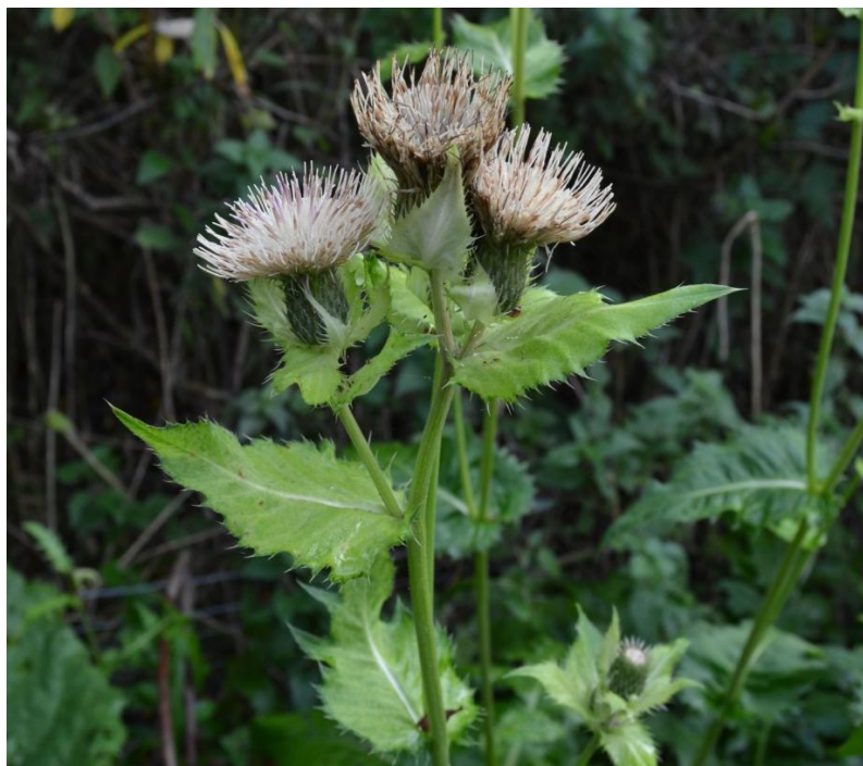
Figur 14. Kåltidsel.

Svampe Alm Blækhat Gulhvid Champignon Hvid Fluesvamp Krystal Støvbld Parasolhat Porcelænshat Skade-Blækhat Spiselig Morkel