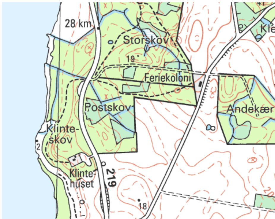
Figur 1. Kort over Klinteskov.

Klinteskov er den smukke løvskov, som ligger helt ud til Tissø midt på søns østlige bred. Skoven afgrænses mod øst af Sæbyvej, og er en del af Natura 2000 området N157 Åmose, Tissø, Halleby Å og Flasken. Skoven indgår desuden som en del af Naturpark Åmosen. Klinteskov er privat og ejes af Selchausdal gods. Se kort fig.1 herunder.