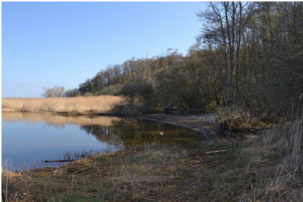
Figur 15. Klinteskov ved Tissø.