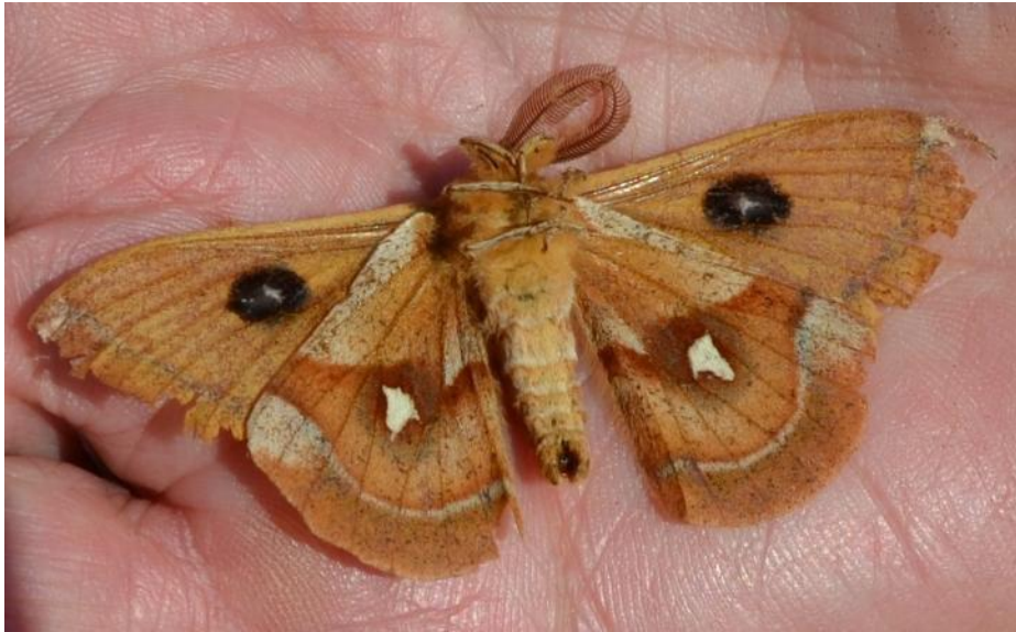
Figur 10. Sømplet, en aftensværmer.