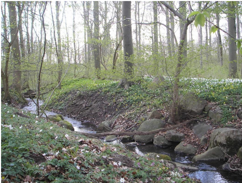
Figur 11. Bækken ved p-pladsen.