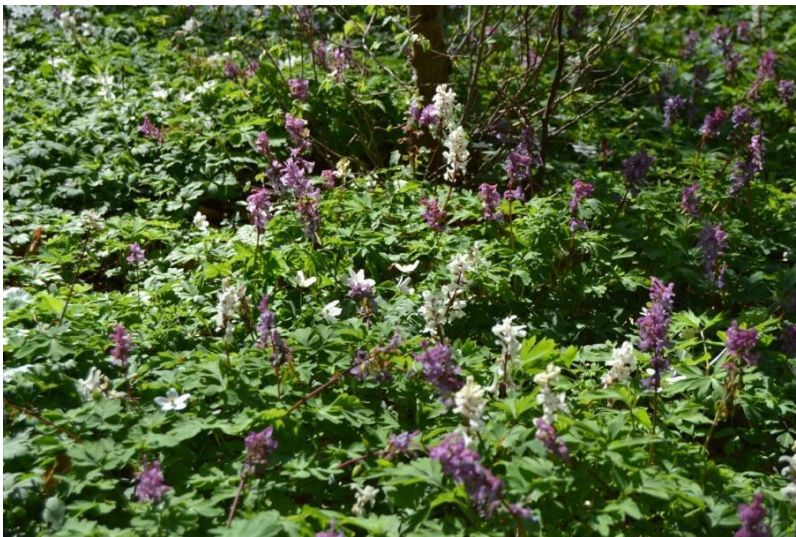
Figur 3. Hulrodet lærkespore, både i lilla og hvid udgave.

Skovens forårsflora er usædvanlig rig. Store partier af skovbunden dækkes af Hvid Anemone, andre steder er det Gul Anemone, som er fladedækkende, og Hulrodet Lærkespore dækker igen andre partier. Nedenfor søskrænten findes Blå Anemone i tusindvis, og i den nordlige del af skoven kan man tælle i hundredvis af Firblad. Alm. Bingelurt dækker også store partier. Ingen af de nævnte arter er sjældne, men deres antal er bemærkelsesværdigt.