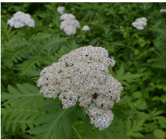
Figur 8. Røllike-Matrem, en sjælden haverelikt.

I den nordlige del af skoven har der ligget 2 bygninger, formentlig et skovløberhus med udhus. Her findes en hel del haveplanter endnu. En sjælden forvildet haveplante vokser i grøftekanten mod Sæbyvej ud for stedet, hvor bygningerne lå, nemlig Røllike-Matrem, se figur 8. Bernt Løjtnant betragter Røllike-Matrem som en gammel prydblade, et haverelikt (Løjtnant, under udgivelse).