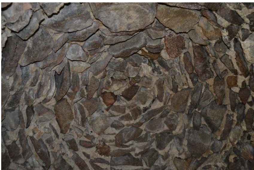
Figur 7. Loftet i ishuset.