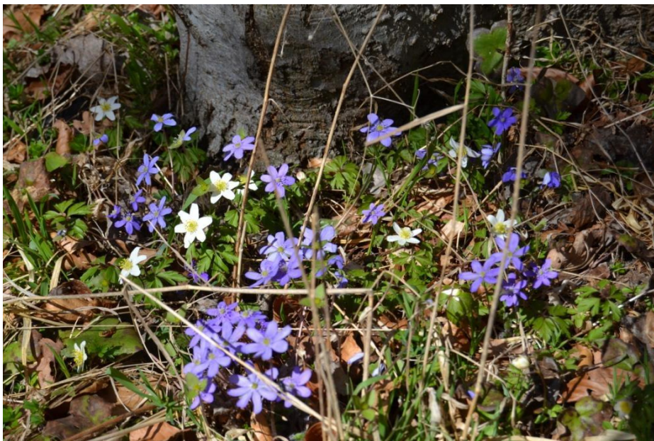
Figur 13. Blå- og hvide anemoner.