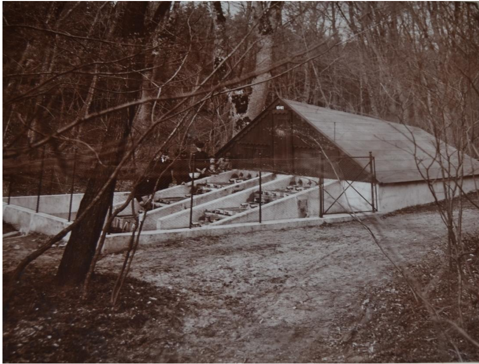
Figur 9. Tissø geddeklækkeri, 1902.