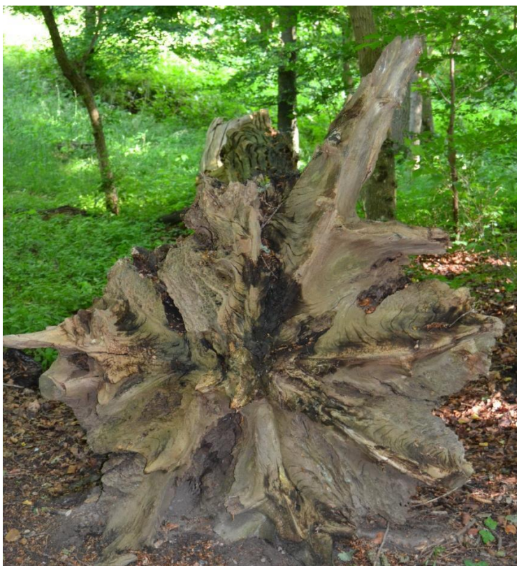
Figur 4. Rod-ende af væltet træ. Der ligger en del dødt ved i skoven, hvilket er berigende for skovens biodiversitet. Dødt ved regnes for et nøgleelement for skoven.