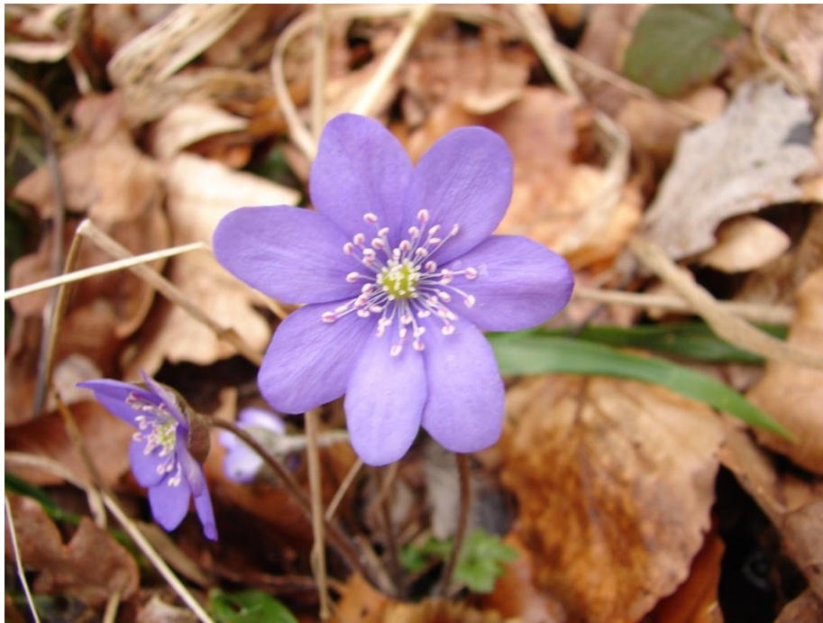
Figur 16. Blå Anemone.