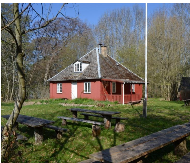
Figur 6. Klintehuset.

Omkring Klintehuset vokser en del haveplanter bl.a. Vinterasters, Lupin, Floks, Sct. Hansurt, Høst-Anemone, Citronmelisse, Rundbladet Mynte, Fersken og Vindrue. Disse er ikke medtaget i plantelisten sidst i rapporten.