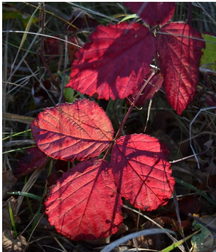
Figur 17. Brombær i efterårsfarve.