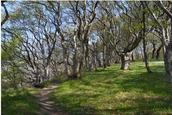
Figur 2. Krogede ege- og bøgetræer på toppen af søskrænten. Søskrænten er en af Klinteskovens nøglebiotoper.